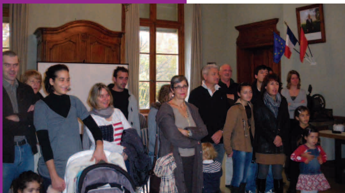
Journée d'accueil des nouveaux arrivants

Cette année, ce sont près de vingt nouvelles familles Pignanaises qui ont participé à la journée d'accueil des nouveaux arrivants, le samedi 24 novembre.