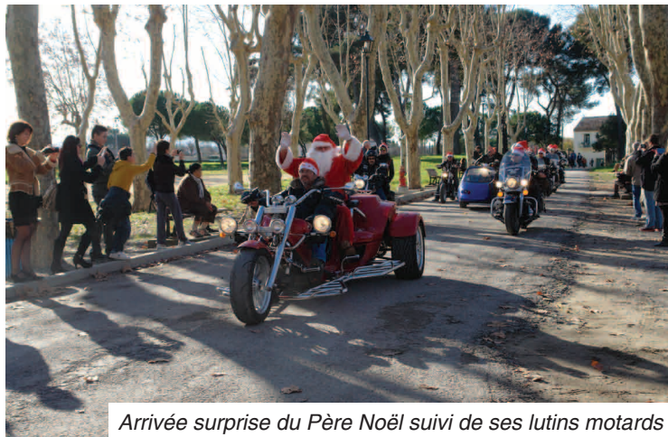
Arrivée surprise du Père Noël suivi de ses lutins motards