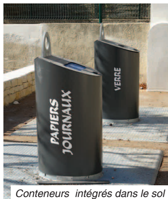
Conteneurs intégrés dans le sol

Des abords paysagés ont été notamment créés, les clôtures des riverains reconstituées et recouvertes d'un parement en pierre pour une meilleure intégration urbaine et les câbles aériens supprimés. Des conteneurs pour le papier et le verre ont été intégrés dans le sol.