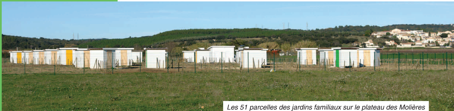
Les 51 parcelles des jardins familiaux sur le plateau des Molières

Pour ce qui est des membres de l'association, entre un cahier des charges, un règlement précis et déjà les premiers conseils sur l'hiver qui approche (« il faut préparer le terrain avec une phase de bêchage, puis enlever les mauvaises herbes en mettant du fumier afin d'enrichir le sol »), ils sont déjà dans le futur.