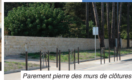
Parement pierre des murs de clôtures