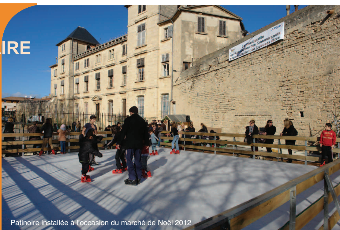
Patinoire installée à l'occasion du marché de Noël 2012