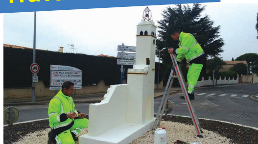
Rénovation du rond-point de la tour de l'horloge