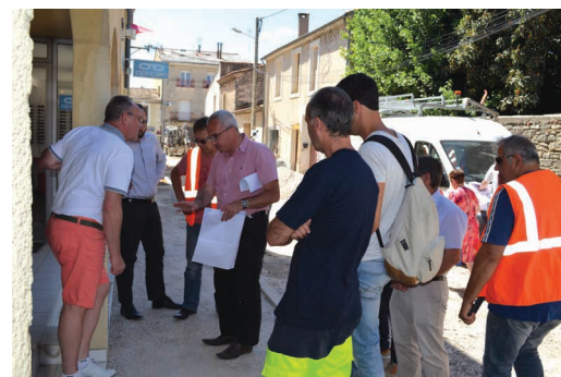
Réunion de chantier en concertation avec les commerçants

La dernière phase située rue de l'enclos et rue de la cité, vient de s'achever au mois de juillet. Ainsi, les réseaux du pluvial, d'eau potable, d'assainissement et les réseaux secs ont fait l'objet de travaux de réhabilitation.