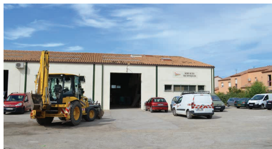
Travaux de peinture sur le bâtiment des services techniques réalisés en régie