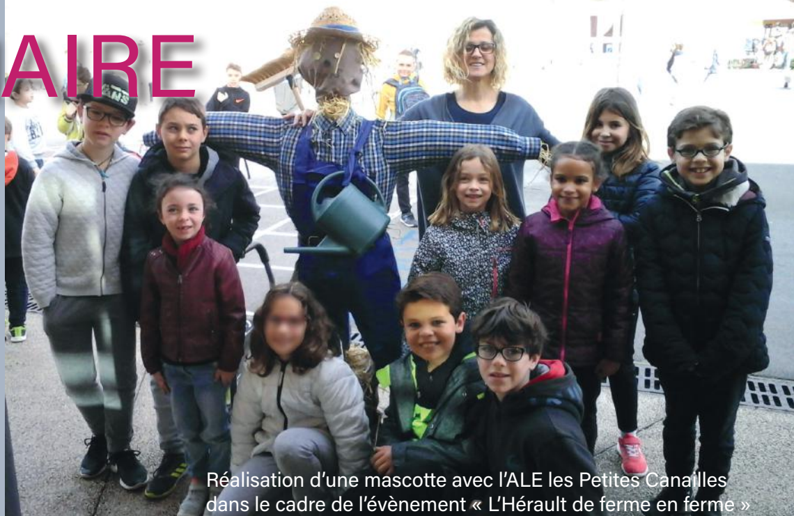
Réalisation d'une mascotte avec l'ALE les Petites Canailles dans le cadre de l'évènement « L'Hérault de ferme en ferme »