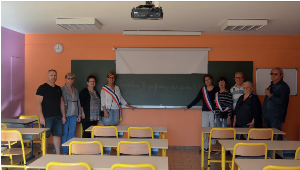
Les élus mobilisés, le jour de la rentrée scolaire, pour l'ouverture d'une classe

Nous avons également la possibilité d'aménager rapidement trois classes supplémentaires puisque les locaux sont, ou peuvent, être rendus disponibles».