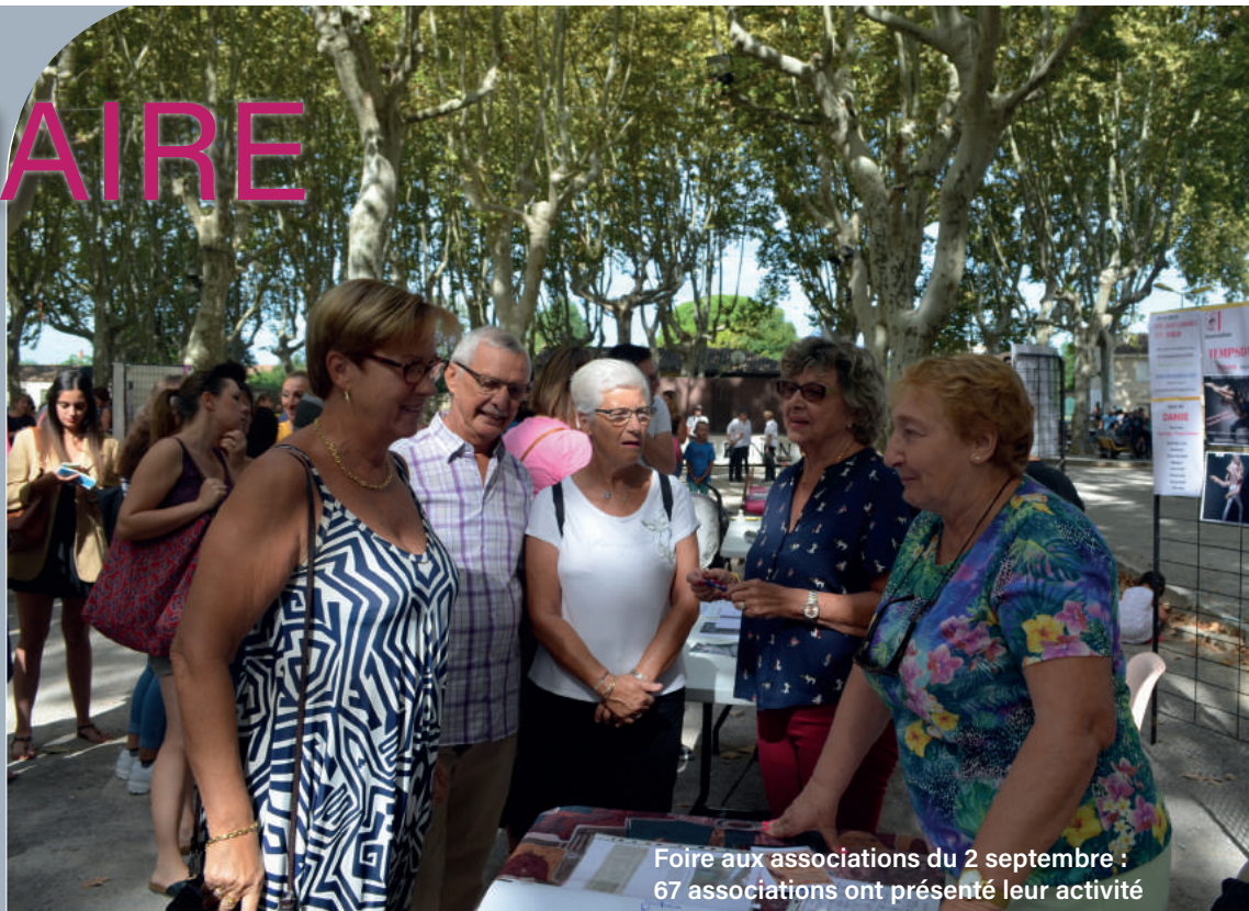
Foire aux associations du 2 septembre : 67 associations ont présenté leur activité