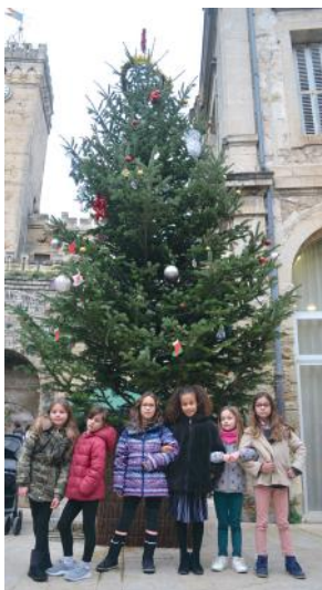
Place du 11 novembre

Bottes, sapins, boules, étoiles... chaque décoration a été dessinée, coloriée, plastifiée et orne les deux sapins communaux. Certains enfants se sont portés volontaires pour participer à cet atelier de création et de décoration. Ils sont venus pour l'occasion poser pour la photo souvenir.