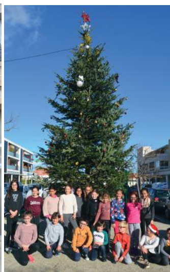
Place de la Bornière