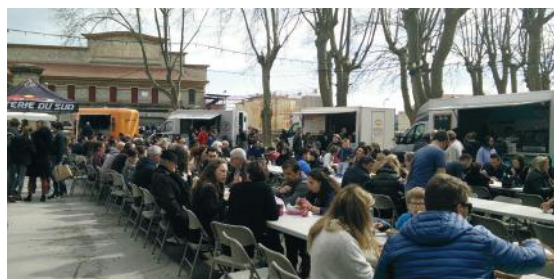
Hiver 2019- N°28 - Le Petit Pignanais

La commune de Pignan accueille un festival Food Trucks, organisé par la Caravane des Délices, qui aura lieu dans le parc du Château le dimanche 17 mars dès 11h. Dégustation de différentes cuisines, animations pour les enfants et scène musicale sont au programme de cette journée.