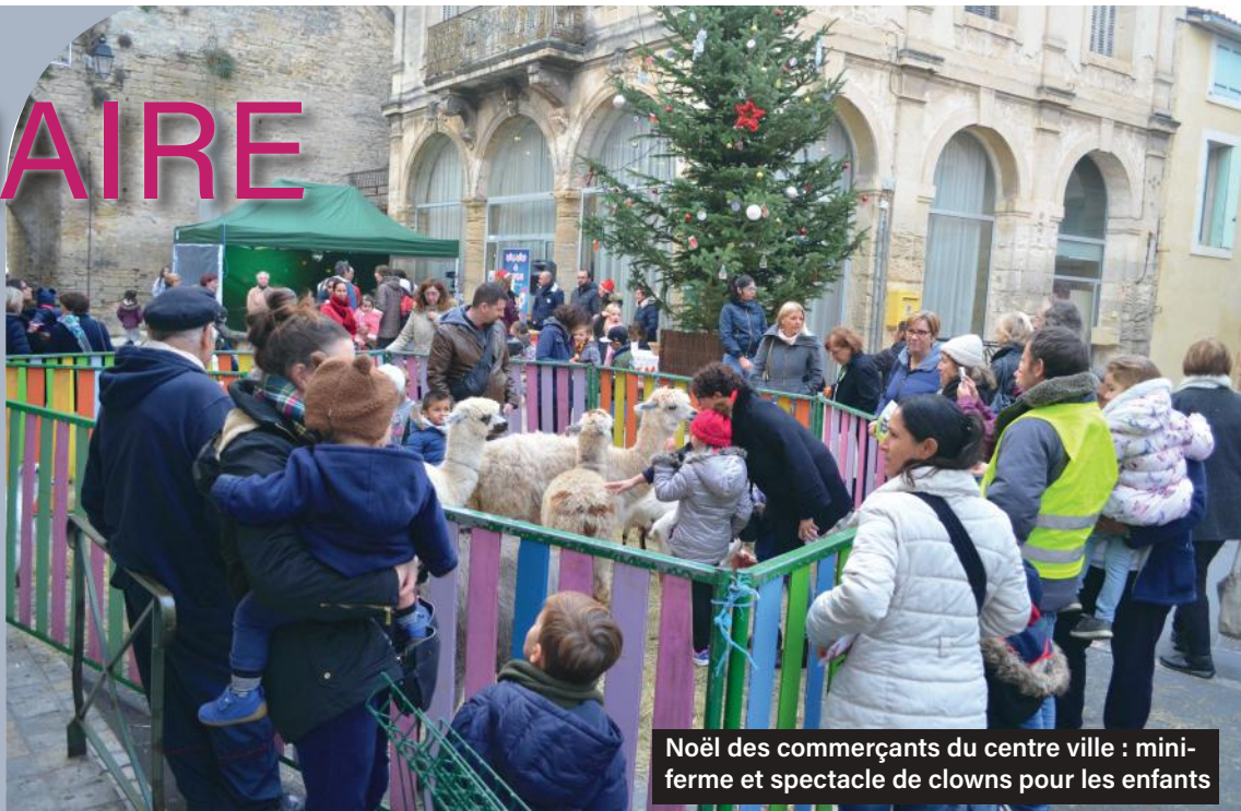
Noël des commerçants du centre ville : mini-ferme et spectacle de clowns pour les enfants