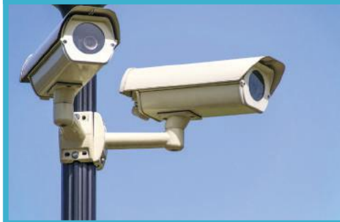
Pose de nouvelles caméras de video-protection