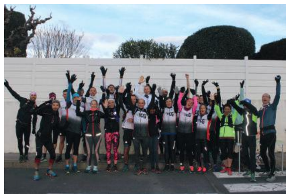
ECG Pignan a reçu le SMA (Saint Mathieu Athlétique) pour une reconnaissance du trail de Pignan

Enfin, pour la première fois cette année, le club a tissé des liens avec un club voisin, le Saint Mathieu Athlétique (SMA).