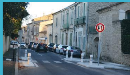
Aménagement voirie et espace public en partenariat avec la Métropole de Montpellier