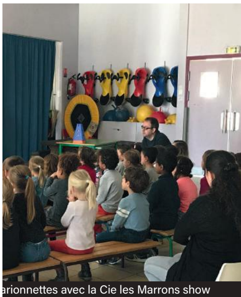
Marionnettes avec la Cie les Marrons show