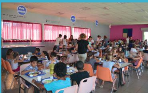
Agrandissement de la cantine Lucie Aubrac