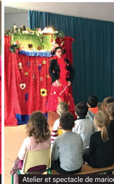
Atelier et spectacle de marionnettes