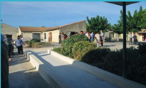
Poursuite de la mise en accessibilité des bâtiments communaux