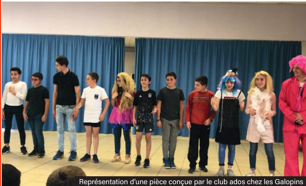
Représentation d'une pièce conçue par le club ados chez les Galopins