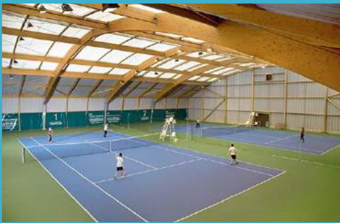
Extension et rénovation du complexe tennistique