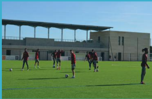
Finalisation du complexe sportif