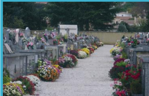
Création d'un nouveau cimetière