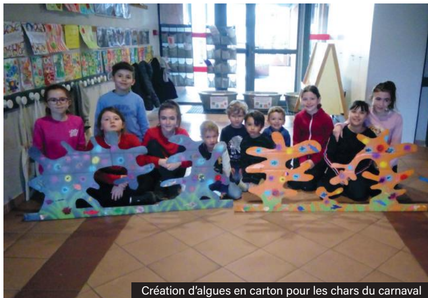
Création d'algues en carton pour les chars du carnaval