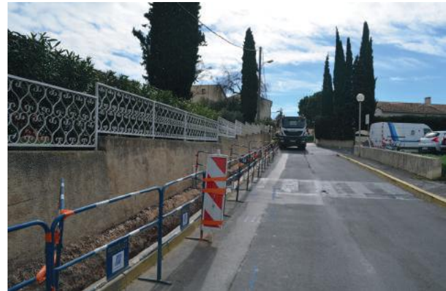
Démarrage des travaux rue de l'ancien lavoir

Ces travaux sont financés par la Commune et réalisés par Montpellier Méditerranée Métropole.