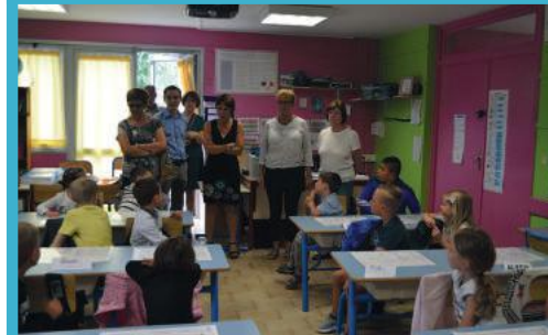
Aménagement et équipement d'une nouvelle salle de classe