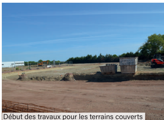
Début des travaux pour les terrains couverts

Les travaux du complexe tennistique vont bon train et les premières réalisations apparaissent.