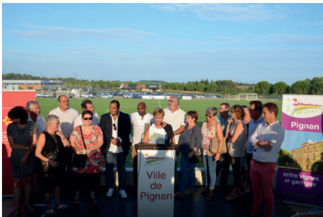
Discours dans les nouvelles tribunes

Cette inauguration fut l'occasion de lancer l'ouverture officielle du complexe et de faire une visite des lieux.