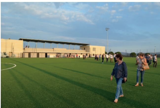
Visite des installations