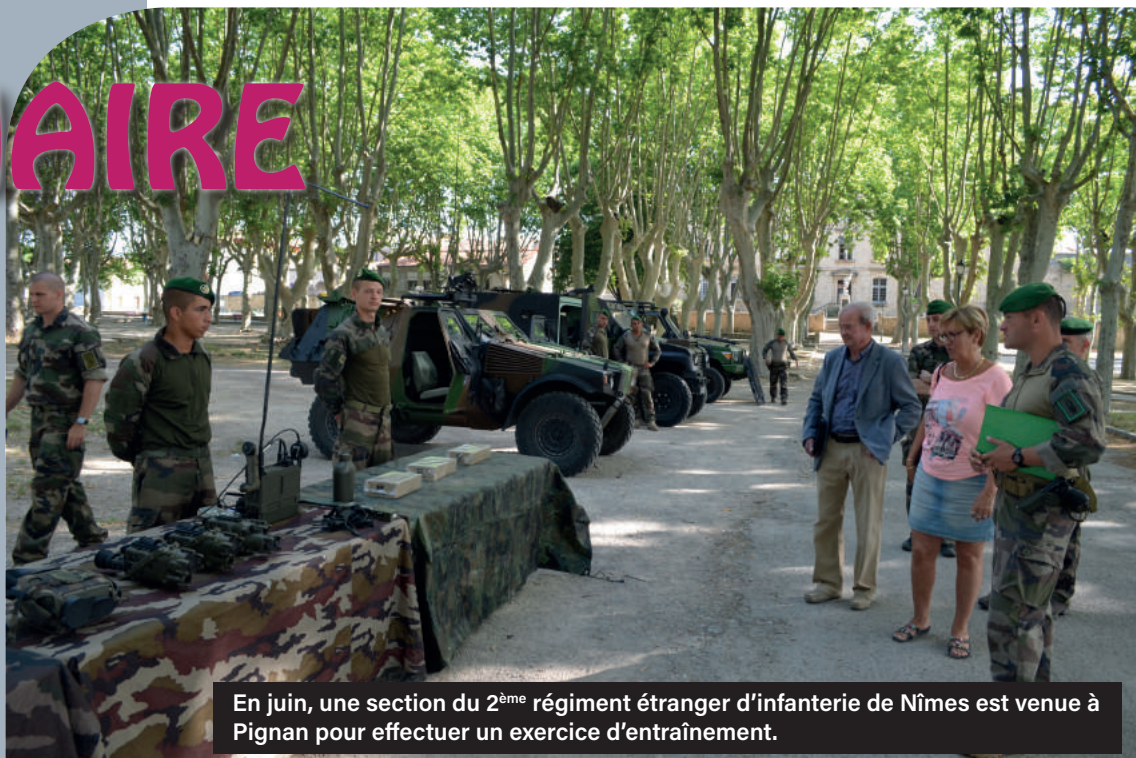
En juin, une section du 2 ème régiment étranger d'infanterie de Nîmes est venue à Pignan pour effectuer un exercice d'entraînement.