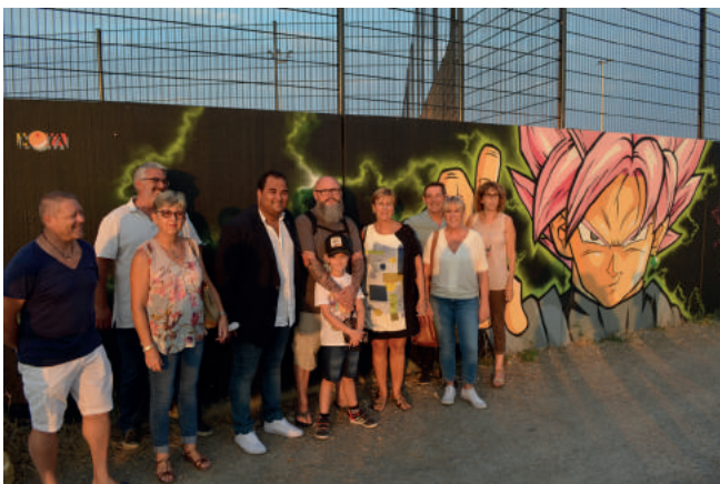
Photo officielle devant la fresque du graffeur Moya (au centre) à proximité du skate-park