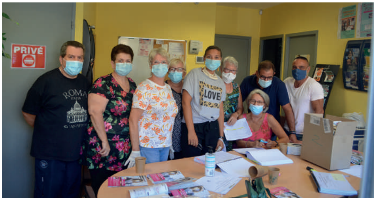
Les élus se mobilisent pour la distribution des masques

Depuis le 20 juillet dernier, le port du masque est obligatoire dans les lieux clos accueillant du public, et à partir du 1 er septembre, il était également obligatoire sur les lieux de travail, dans les collèges et les lycées. La ville de Pignan a donc procédé à une seconde distribution de masques dès le 24 août.