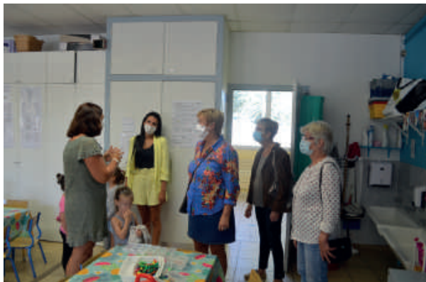
Mme le Maire et les élues à la Petite Enfance ont visité des classes

Mardi 1 er septembre, les 865 élèves des écoles Lucie Aubrac, Louis Loubet et Marcellin Albert ont enfin repris le chemin de l'école après plusieurs mois d'absence.