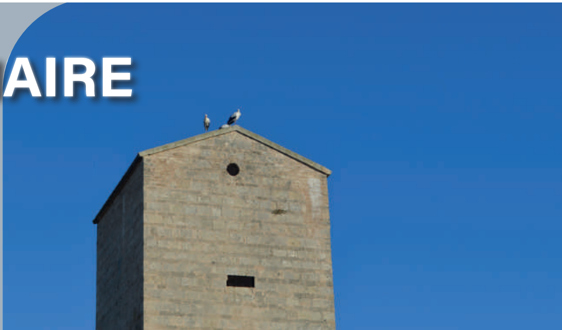
Trois cigognes de passage à Pignan...