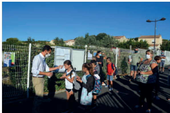
Le directeur de l'école Marcellin Albert vérifie la température des enfants

A l'entrée des trois écoles, le protocole sanitaire était le même : masque obligatoire pour les parents, gel hydroalcoolique et prise de température avant de rentrer dans l'école.