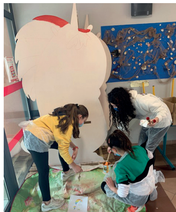
Préparation de la mascotte Gaston la licorne

Pour clôturer les ateliers de l'année, le spectacle du mois de juin était axé sur ce thème. Par la danse ou des expressions corporelles, chaque enfant a pu exprimer l'ensemble des émotions.