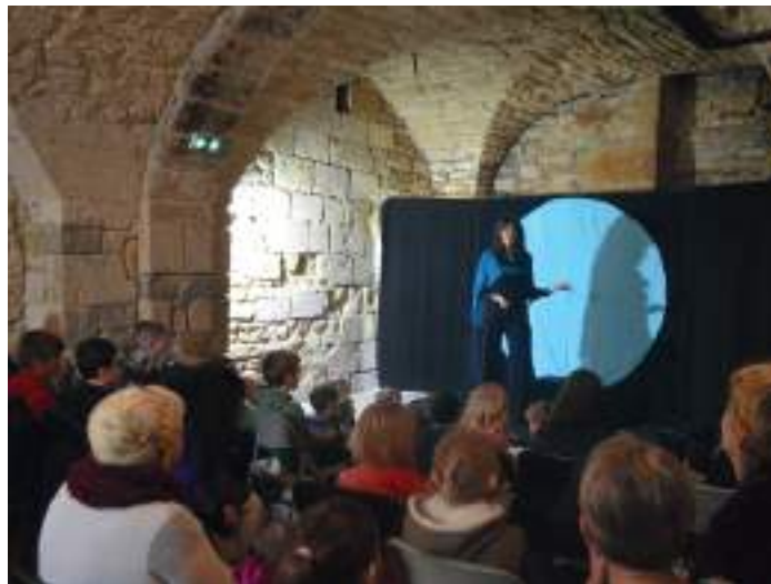
Spectacle pour les enfants

Cette année encore le salon a su mettre en valeur la richesse éditoriale régionale : auteurs de romans policiers, bibliographes d'acteurs et de chanteurs, auteurs de livres jeunesse ou bien encore des ouvrages sur la région, il y en avait pour tous les goûts et tous les âges. Dans ce cadre d'exception que sont les caves voutées du château, pas moins d'une trentaine d'auteurs ont présenté leurs ouvrages au public.