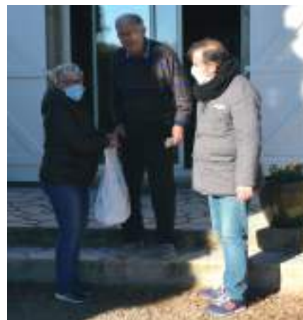
Distribution des colis par les élus

Plus de 300 colis ont été préparés avec soin par une quinzaine de personnes, dans la bonne humeur. Pendant plusieurs semaines, les membres du CCAS ont ensuite rendu visite à chaque personne ou couple et ont profité de ce moment privilégié pour échanger avec chacun.