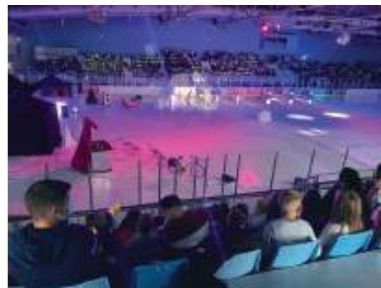
Spectacle de Noël sur glace à Lucie Aubrac