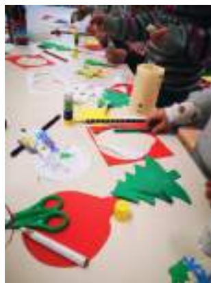
Création de décorations à Louis loubet