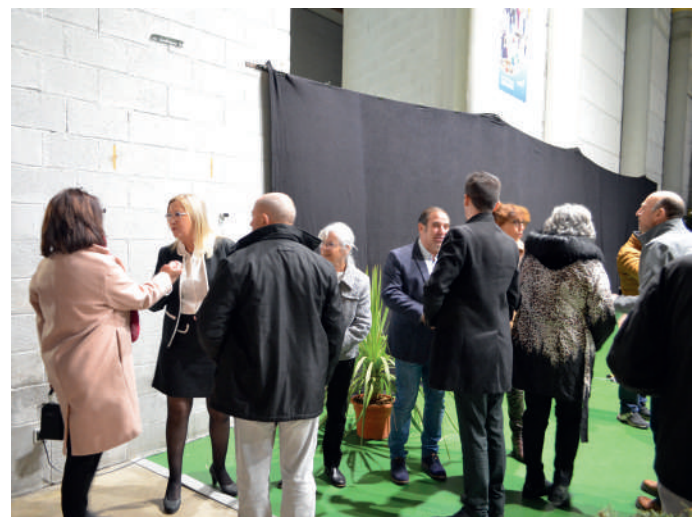
Mme le Maire et les élus accueillent tous les Pignonais

Chacun de vous a subi et subit encore la hausse du coût de la vie et il nous est donc impensable de vous demander un effort supplémentaire. C'est pourquoi, je proposerai une nouvelle fois au conseil municipal de ne pas augmenter les taux communaux d'imposition.»