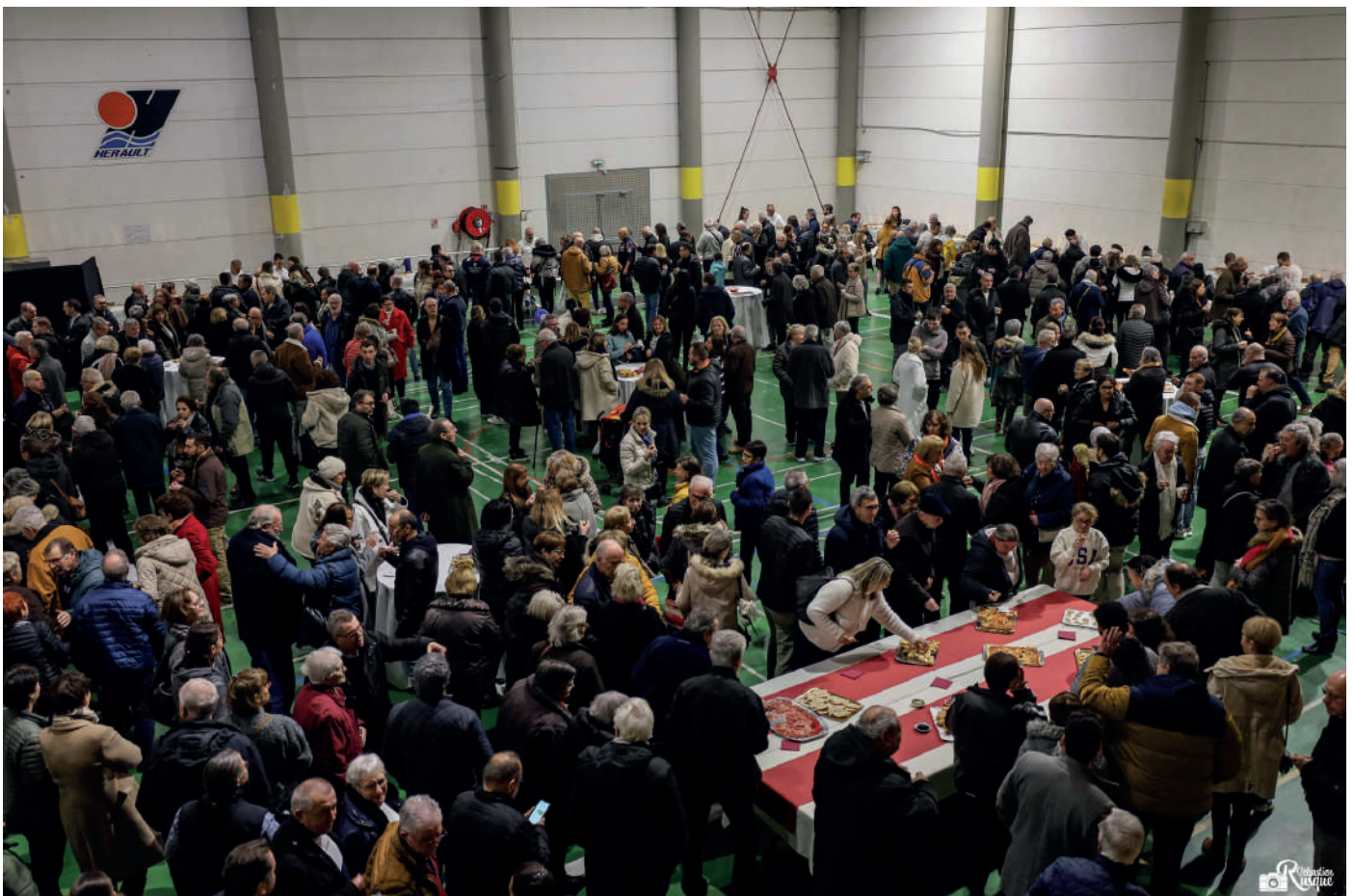
Cocktail de clôture