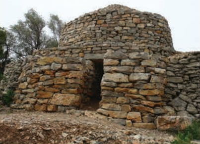
Capitelle de calcaire

Ce chantier avait été primé par Maisons paysannes de France et la fondation du patrimoine, un prix national qui honore la transmission d'un savoir.