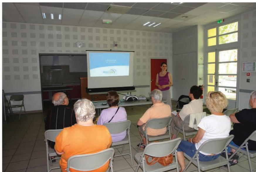
Une quinzaine de participants en moyenne a assisté aux ateliers

Suite à la réunion d'information du 27 avril 2013, l'atelier diététique et bien-être mis en place par le CCAS a débuté le mardi 11 juin avec l'association Brain Up.