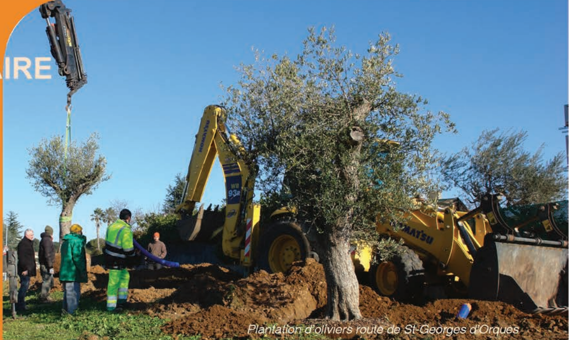
Plantation d'oliviers route de St-Georges d'Orques