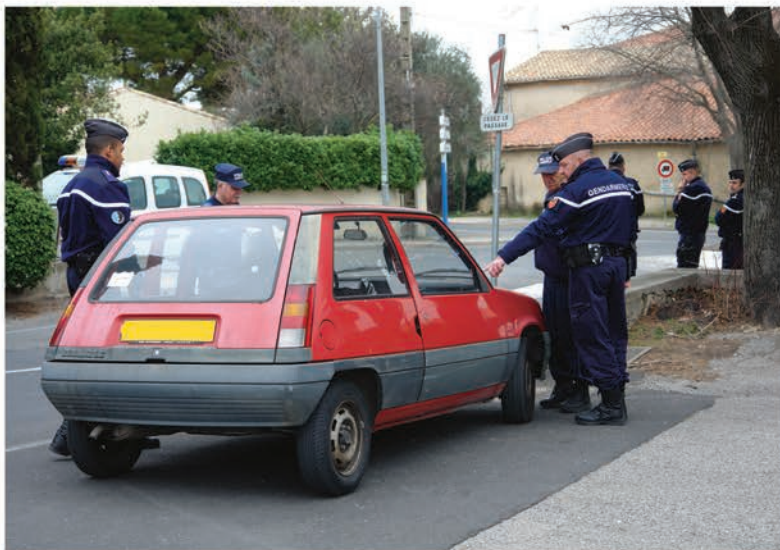
Opération conjointe organisée en mars dernier

Cette avancée technologique est une première en France. Elle permet de renforcer les actions de prévention déjà existantes en exploitant les possibilités offertes par les nouvelles technologies.