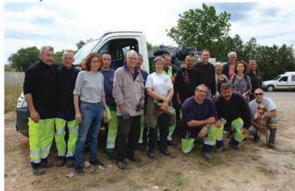
L'équipe des services techniques, les bénévoles, des élus et Mme le Maire ont participé à l'opération de nettoyage

Pour information, la déchetterie de Pignan est ouverte du lundi au samedi de 9h à 12h et de 14h à 18h (jusqu'à 19h à partir du mois d'avril) et le dimanche de 9h à 12h.