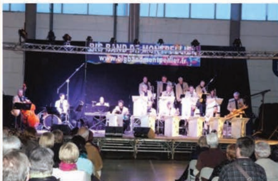
Big Band de Montpellier en concert à la salle du Bicentenaire