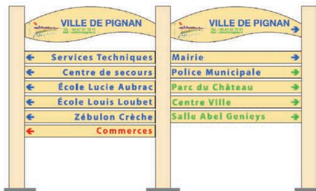
Maquette non contractuelle de la nouvelle signalétique d'intérêt local

Cette signalétique va concerner les bâtiments publics et les commerces. Elle sera autofinancée par la commune.