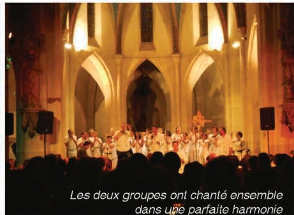
Les deux groupes ont chanté ensemble dans une parfaite harmonie

Jazz, gospel, classique, celtique, le programme éclectique de cette 11 ème édition a attiré bon nombre de spectateurs.